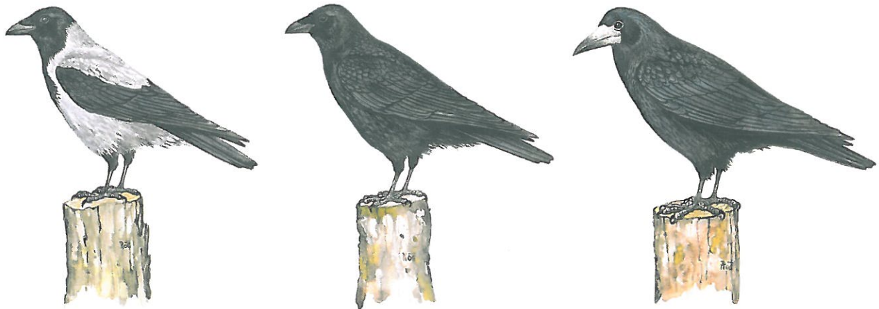
Slika 1: Siva vrana ( Corvus cornix ) Slika 2: Črna vrana ( Corvus corone ) Slika 3: Poljska vrana ( C. frugilegus )

V zelo redkih primerih lahko pride do napadov sivih vran na ljudi, kadar se ti preveč približajo negodnim mladičem. Večinoma gre za simulirane napade z bližnjim preletavanjem, izjemoma pa do fizičnega napada. S privajanjem ljudi na ponovno sobivanje z vranami v mestih se da takšnim konfliktnim situacijam v pretežni meri izogniti.