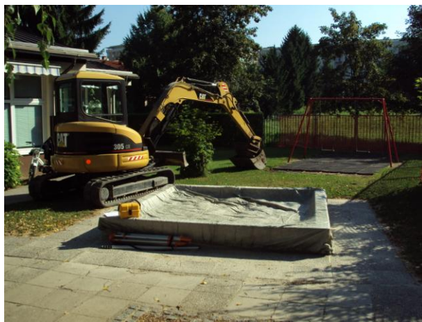
Začetek del: 9.7.2012