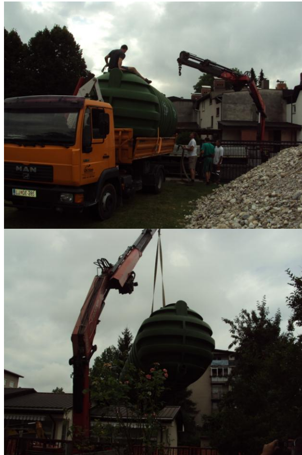
Na svoje mesto so cisterne postavili s pomočjo dvigala.