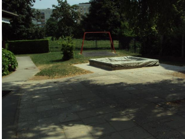
LOKACIJA kjer stojijo zalogovniki (začetek julija).